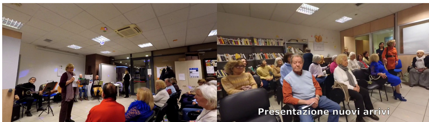
Assemblea con presentazione nuovi arrivi